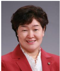
相談事は、お気軽にご連絡下さい

盆花には間に合いませんでしたが、アスターがきれいに咲きました。去年の花から採った種を蒔いて育てました。(8/30)