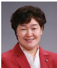
相談事はお気軽に ご連絡下さい

濃いピンクのシャクヤク 今年には多くの花が咲いて、 何人かの方にお裾分けもできました。 (6/4)