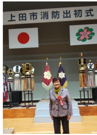
1月21日、上田市消防出初式。悪天候で、市中行進など外の催しは中止されましたが、サントミューゼで式典が行われました。今年は議会の役職で、来賓として出席しました。午前には本原分団の出初式がありました。