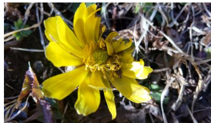
今年もフクジュソウが厳寒でも、もう咲いています。(写真は1/30)